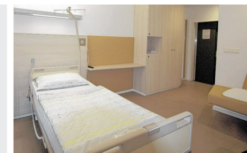
Die Zimmer sind modern ausgestattet und technisch auf dem neuesten Stand.