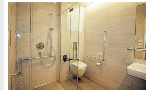
Der Waschraum der neuen Zimmer im dritten Obergeschoß ist großzügig gestaltet.