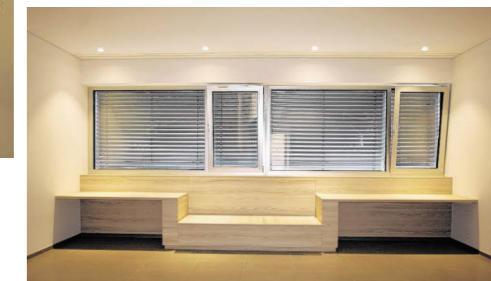
Hier können Patienten Platz nehmen, die einen Termin bei der Augenheilkunde haben.