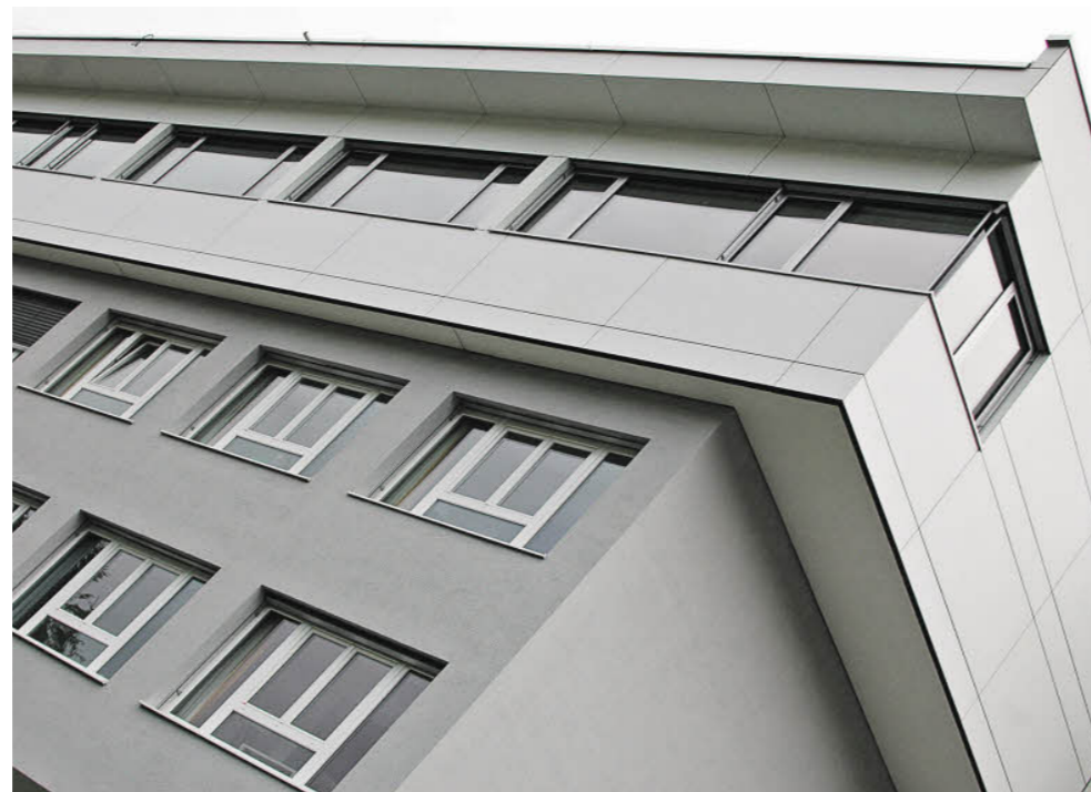
Die EMCO Privatlinik in ihrem heutigen Erscheinungsbild.